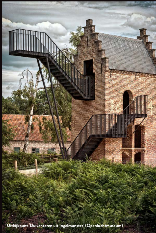
Uitkijkpunt 'Duiventoren uit Ingelmunster' (Openluchtmuseum)