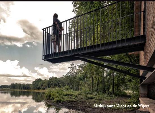
Uitkijkpunt 'Zicht op de Wijers'